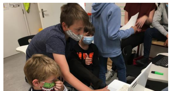
Opdracht voor het 6 de leerjaar: organiseer je eigen proclamatie! Hoe kunnen we gezinsbubbels veilig organiseren op de speelplaats? Hoeveel hapjes/drankjes kan je kopen met een budget van 10 euro per gezin? Alles wat in de kleuterschool en lagere school aan bod kwam, passen we toe in een levensechte opdracht.