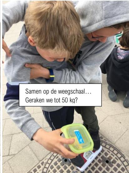
Samen op de weegschaal... Geraken we tot 50 kg?