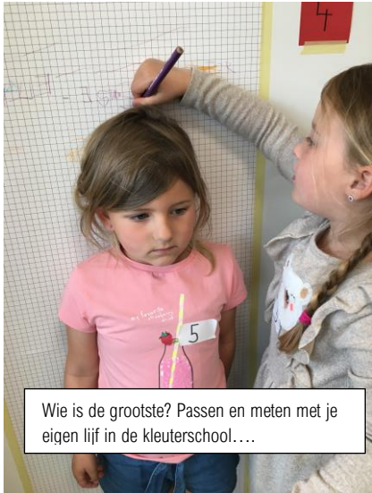
Wie is de grootste? Passen en meten met je eigen lijf in de kleuterschool....