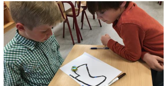
Programmeren in het vierde leerjaar: lees de code en laat een 'robotje' een parcours afleggen binnen een bepaalde tijd.