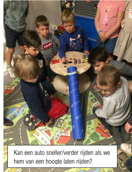
Kan een auto sneller/verder rijden als we hem van een hoogte laten rijden?